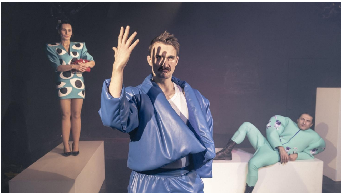
Z představení dokumentárního divadla Istanbulská úmluva