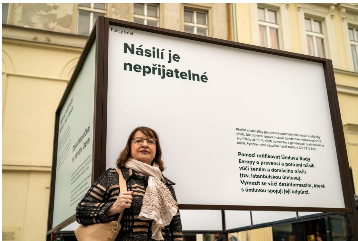
Senátorka Miluše Horská podpořila naši kampaň.

zahrnuje popis problému i návrhy řešení. Naše stránky a sociální sítě navštívilo na 30 000 osob. Policy paper Muži a moc ve veřejné sféře byl přijat Radou vlády pro rovnost žen a mužů.