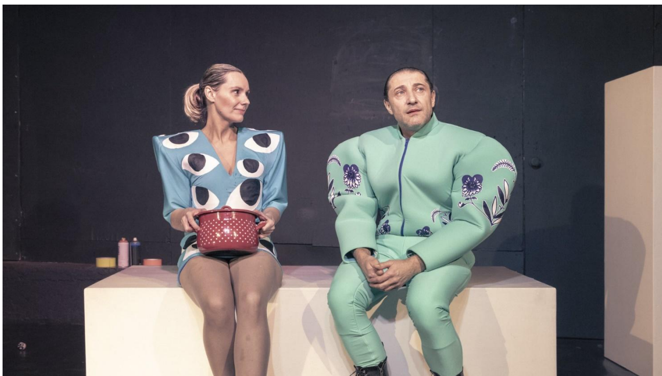
Z představení dokumentárního divadla Istanbulská úmluva